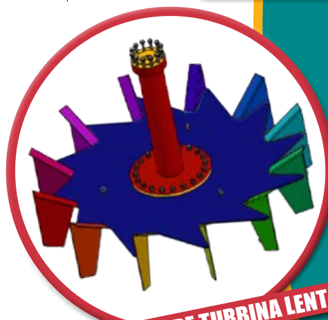
AIREADOR DE TURBINA LENTA