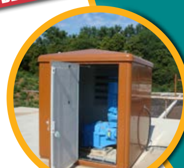
CUBIERTAS MATERIAL COMPUESTO